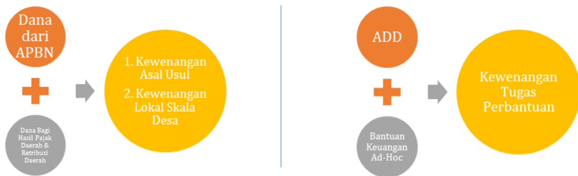
Diagram 1 - Hubungan Kewenangan & Anggaran Desa

Titik tekan penggunaan anggaran desa harus disesuaikan dengan kewenangannya. Kewenangan berdasarkan hak asal-usul dan kewenangan lokal berskala desa diatur dan diurus oleh desa dengan menggunakan sumber anggaran dari APBN dan Bagi Hasil pajak daerah maupun retribusi daerah. Adapun pelaksanaan kewenangan tugas perbantuan dari entitas pemerintahan di atasnya seperti kabupaten, kota, provinsi dan pemerintah pusat akan dibiayai melalui Alokasi Dana Desa (ADD) dan bantuan keuangan lain yang bersifat lebih ad-hoc atau tidak terus menerus.